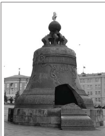
Царь-колокол в Московському Кремлі (висота є 6,24 м, діаметр 6,6 м, маса близько 200 т.)

Брат, що його хтось образив, прийшов до старця в келію і говорить йому: Отче, я скорблю. Старець питає: Від чого? Він сказав: Один брат образив мене, і мене мучить диявол, доки я не відплачу йому. Старець каже: Послухай мене, сину, — і Бог спасе тебе від цієї пристрасті. Для примирення з братом піди в свою келію і мовчи, і ревно молися Богові за брата, що тебе образив. Брат пішов і зробив, як йому сказав старець. І через сім днів Бог відняв від нього гнів задля присилування, Що він чинив над собою і задля послуху старцеві.