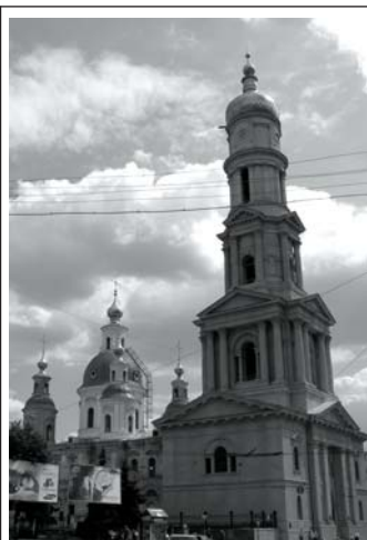
Дзвінниця Успенського собору, м.Харків

З піднесеним духовним настроєм сіли на поїзд Харків — Баку, що йшов через Астрахань.