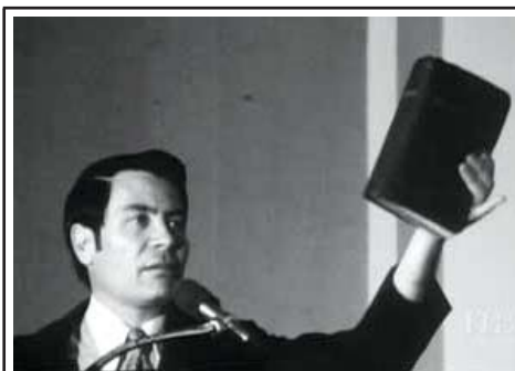
Свідки Єгови часто наголошують на тому, що вони люблять вивчати Св.Писання

2. Свідки Єгови викривляють слова Отців Церкви.