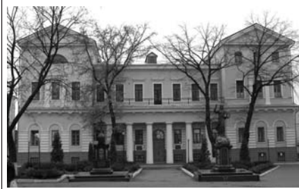
Архієрейський будинок, сучасний вид, м.Харків

до дрібниць контролював усе. При ньому в Харкові був побудований архієрейський будинок, в якому, крім архієрейської резиденції, розмістився колегіум і була влаштована церква в честь св.апостола Івана Богослова. Він почав будувати дзвінницю Успенської церкви. Розсилав по єпархії Біблії, боровся з суєвір'ям.