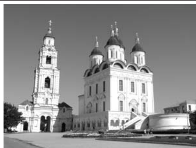
Астраханський Успенський собор з криптою-усипальницею