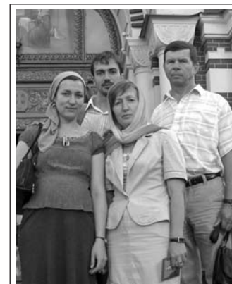
Паломники із Зазим'я, м.Харків

- Знаете, вас Господь послал. Я вас сейчас познакомлю с о.Максимумом он много знает об истории епархии и вам расскажет.