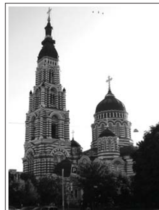
Благовіщенський собор, м.Харків

в Астрахані і тому щодо Харкова у нас особливих планів не було. Ми мали вранці побувати на службі і після обіду о 15-00 пересісти на Астраханський потяг.