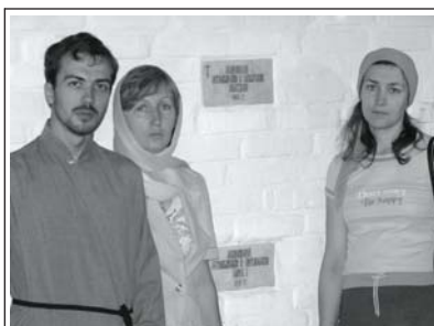
Місце захоронення архієп.Павла, крипта-усипальниця