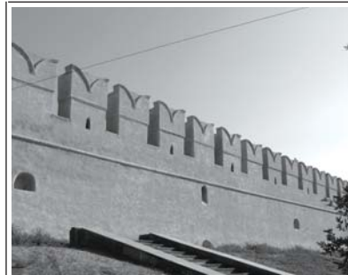
Стіна Астраханського кремля.

Перед нами постало густо засаджене зеленню місто з типовими дерев'яними будинками. Населення міста багатонаціональне: росіяни, узбеки, казахи, татари - приблизно 150 націй. В Астраханській області є навіть українські поселення. Люди, які нам зустрічались, на