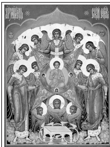
Икона “Архангельский Собор”

Впрочем, некоторые Отцы Церкви высказывают мнения, что разделение ангелов на девять ликов охватывает только те имена, которые открыты в слове Божию, но не объемлет других имен и ликов ангельских, которые нам еще не открыты. Так, например, ап. Иоанн Богослов в книге Откровения упоминает о таинственных “животных” и о семи “духах” у престола Божия: “Благодать вам и мир от